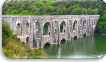
Mağlova Su Kemerini

(1) Eski yıllarda İstanbul'un su ihtiyacını nasıl karşıladığını bilmek isteyen Mimar Sinan'ın Mağlova Su Kemerini bir şeyler fısıldayacaktır.